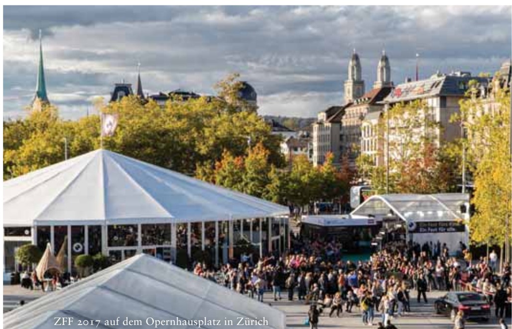
ZFF 2017 auf dem Opernhausplatz in Zürich

MSR: Da passen kleinere und unabhängige Filmproduktionen ins Konzept, die thematisch und narrativ deutlich andere Schwerpunkte setzen als Blockbuster. Ändern Sie als Festivalleiter entsprechend