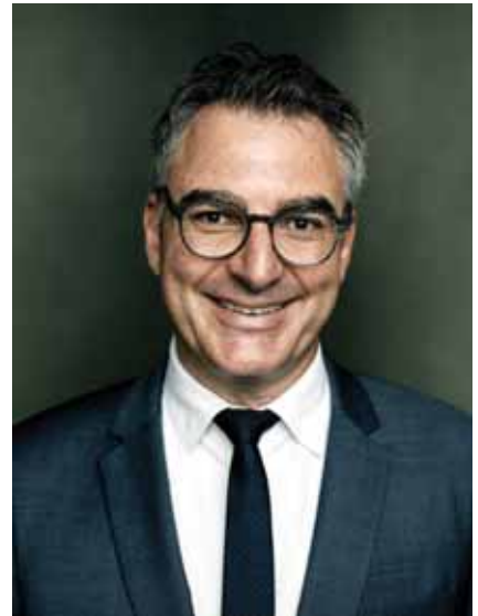
Foto: Christian Jungen, Festivaldirektor

Weitere Informationen: www.filmpreis-der-kirchen.ch