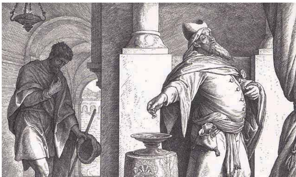
Aus: Julius Schnorr von Carolsfeld. Die Bibel in Bildern . Leipzig, 1860. Tafel 200. http://digi.ub.uni-heidelberg.de/diglit/schnorr_von_carolsfeld1860bd2/0046

Doch diese Anerkennung ist zu tiefst ambivalent. So produktiv sie für die Gesellschaft und jeden Einzelnen sein kann, sie ist flüchtig und schnell verloren. Zudem vergleichen wir ja oft nach oben, mit denen, die es gleich gut oder besser haben. Das kann auf die Dauer nicht ohne Frustration gehen. Wer sich seine Selbstlegitimation und sein Daseinsrecht auf dem Boden ständigen Vergleichens baut, lebt nur im Auf und Ab seines äusseren Erfolgs und Ansehens. Da hilft es meist nicht einmal, ein paar Menschen um sich scharen, denen es ein