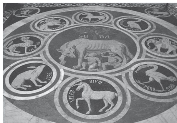
Detail vom Boden im Dom von Siena

Über Pienza fahren wir nach Siena. Die Stadt liegt nicht nur rosenrot auf dem Hügel, sie ist die Erhabene, mit dem wohl schönsten Platz der Welt, dem Campo. Gibt es eine Steigerung? Architektonisch gewiss im Dom, in dem wir sogar den weissen mit Mosaik und eingelegten Figuren geschmückten Boden bewundern können. Vom beeindruckenden Dommuseum sei nur die Maestá von Duccio genannt, deren Anblick überwältigt. Und so voller Touristen die Stadt auch ist, den