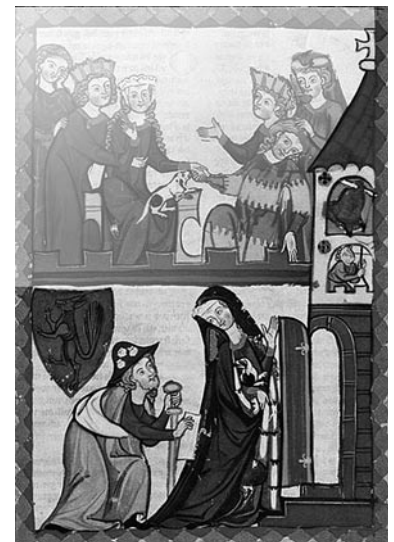
Hadlaub als Pilger verkleidet steckt seiner verehrten Dame vor dem Fraumünster sein Brieflein «von sender Klage» zu. Codex Manesse, fol. 371r. Um 1305. Universitätsbibliothek Heidelberg

Pilger, die in Zürich vorbeikamen, haben zweifellos nebst den Gräbern der Märtyrer Felix und Regula auch die Marienkapelle im Fraumünster mit dem Altar der Maria und der Heiligen Drei Könige, der Schutzheiligen der Pilger und Reisenden, aufgesucht. Es muss deren so viele gegeben haben, dass man als Pilger beim Fraumünster offenbar nicht auffiel. Sonst hätte sich der Zürcher Minnesänger Hadlaub nicht als solcher verkleidet, um der von ihm verehrten Frau heimlich sein Brieflein «von sender Klage» (voller Liebesklagen) zuzustecken, wie dies die abgebildete Miniatur aus der manessischen Liederhandschrift zeigt 6 .