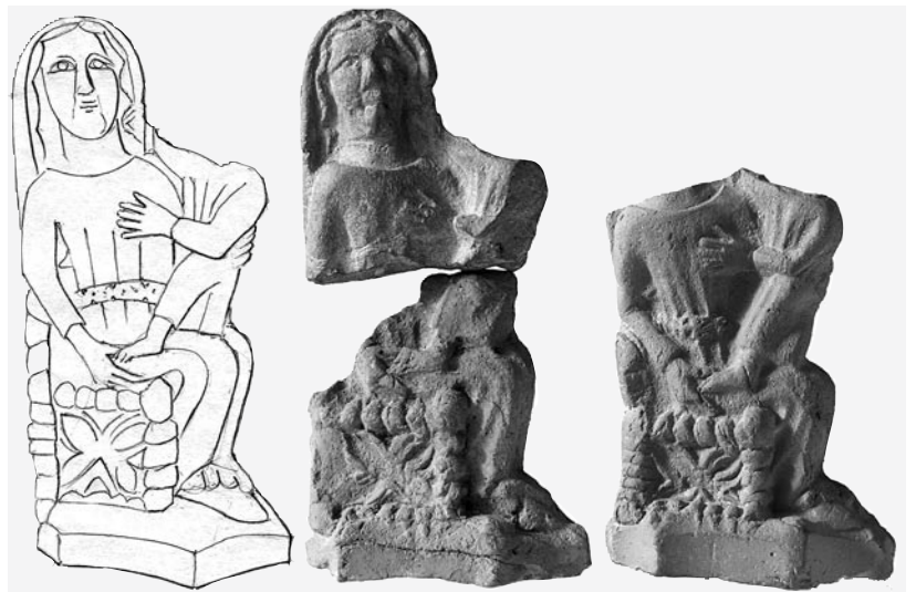
Thronende Muttergottes mit Kind aus gebranntem Ton. Höhe 9,8 cm. Bodenfunde vom Areal der Fraumünsterpost, wo Konrad Hafner seine Hafnerwerkstatt hatte. Um 1370/ 80. Schweizerisches Landesmuseum.

dass die Werkstatt, die sich am Fundort befand, von Konrad Hafner betrieben wurde. Konrad Hafner war im Lauf der Jahre so erfolgreich, dass er 1374, 1380 und 1382 Zunftmeister zu Zimmerleuten wurde und als solcher dem Kleinen Rat der Stadt angehörte. Seine Werkstatt produzierte nicht nur mit Reliefbildern geschmückte Ofenkacheln, sondern auch kleine Tonfiguren, die mit Hilfe von Modeln in Serie hergestellt wurden. Davon gibt es verschiedene Modelle, so auch die Statuette einer thronenden Madonna mit Kind. Die Figur ist nur in Bruchstücken von wenigen, nicht zusammengehörenden Ausformungen auf uns gekommen, doch lässt sie sich rekonstruieren bis auf den Kopf des Kindes, der verloren ist.