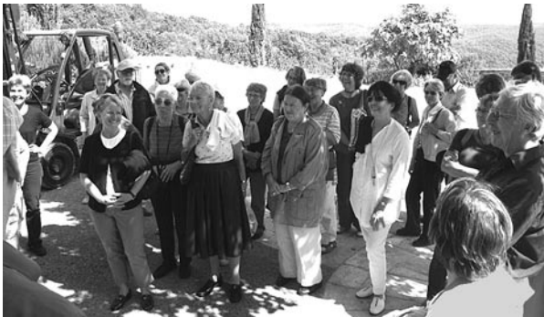
... in den Hügeln des Chianti ...

Auf Siena folgt eine Weindegustation: – Brancaia – in den Hügeln des Chianti erwartet uns, und damit ein Wein von allererster Güte, aber auch die Erkenntnis, dass die Weinherstellung harte Arbeit ist und, wie immer, wenn Grosses entstehen soll, Lust und Liebe sowie viel Kreativität hinzukommen müssen.