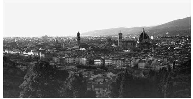
Abschied von Florenz vor der Basilika San Miniato al monte

Auf der Heimfahrt wird uns mit dem Baptisterium in Parma ein weiteres Kleinod geschenkt. Oft sind es die kleinen Dinge, die unsere Seele berühren: mir geht es so mit einem Engel von geradezu heiliger Einfachheit auf einem Relief mit der Flucht nach Ägypten, der mit grosser Gewissheit den Weg weist... Und plötzlich schwingt sich