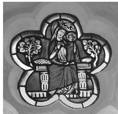
oben: Thronende Madonna mit Kind. Glasgemälde im Kreuzgang des Zisterzienserklosters Wettingen (um 1280/90).